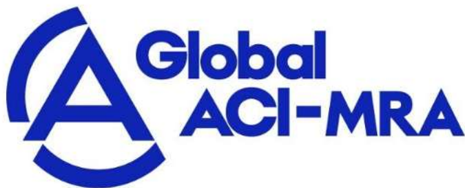
圖 2 全球認證合作組織多邊承認協議標記（MRA MARK）